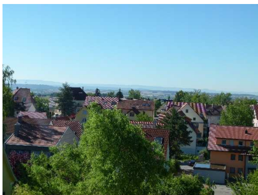
Ausblick 2. Obergeschoss