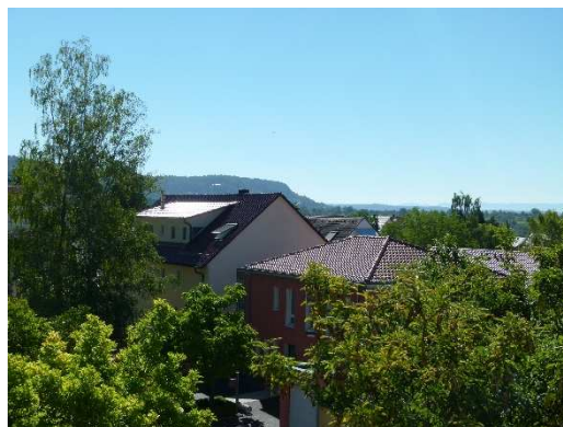
Ausblick 1. Obergeschoss